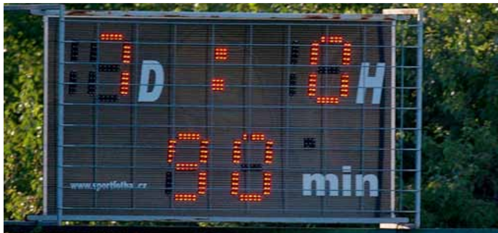
Skóre s Braničkem před 14 dny se zastavilo na 7:0