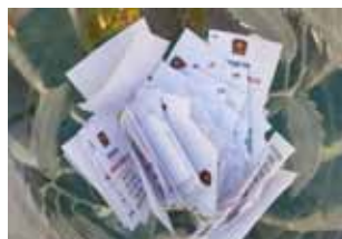
Tak který z lístku v tombole vyhraje dnes?