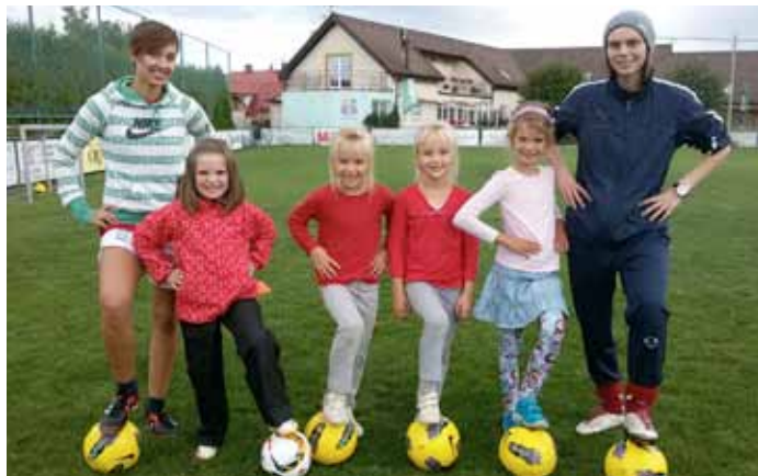
Zakládáme dívčí tým. Zkušené trenérky, dobrá atmosféra. Zajímá vás to? Ptejte se.