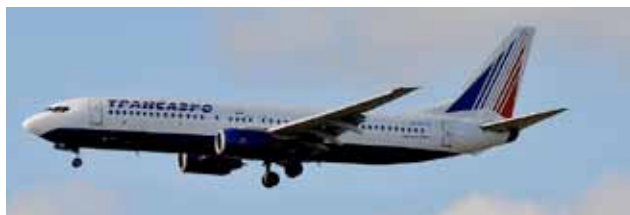
Pohledy na letadla nad kopaninským stadiónem nikdy neomrzí